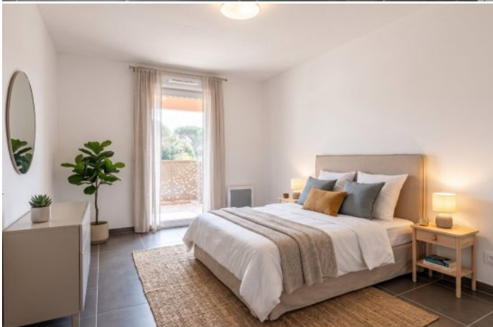
photo non contractuelle, image retouchée par IA - ce bien est vendu sans cuisine équipée