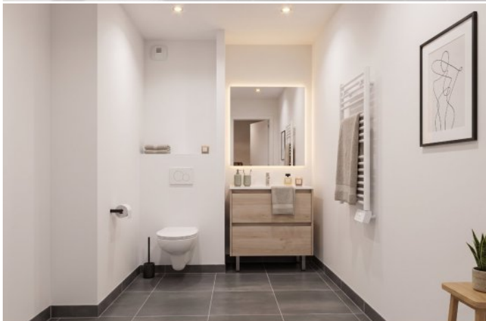
photo non contractuelle, image retouchée par IA - ce bien est vendu non meublé