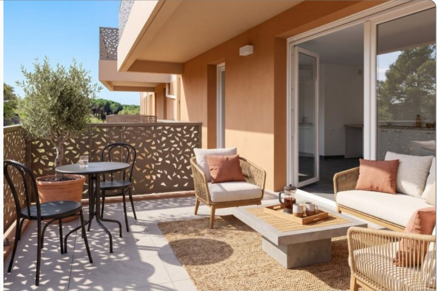
photo non contractuelle, image retouchée par IA - ce bien est vendu non meublé