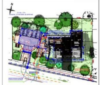
Plan Masse de repérage