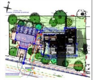
Plan Masse de repérage